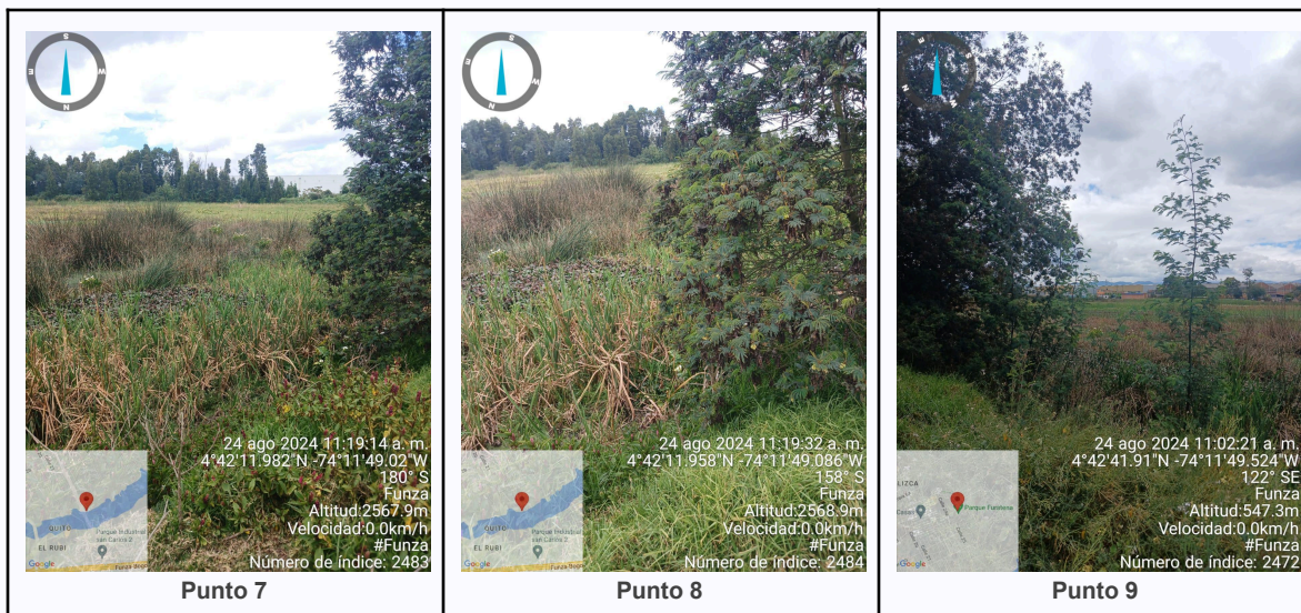
JENNIFER ANDREA TOVAR RODRÍGUEZ Contratista Contrato de prestación de servicios CPS20240972

C.P 250020 Tel. (601) 8234070 823 40 71 / 823 40 73 Fax. (601) 8257620 Dir. Cra. 14 No. 13-05 03-FR-17 VER.10.2024